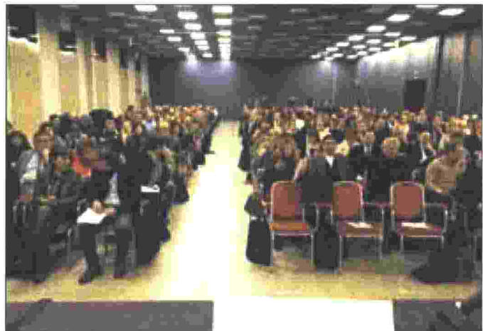
La platea del convegno